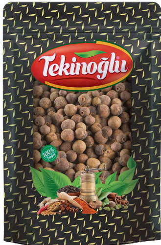
YENİBAHAR / ALLSPICE