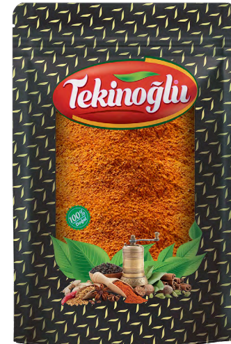
TARÇIN / CINNAMON