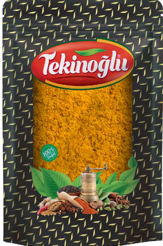
KİMYON / CUMIN