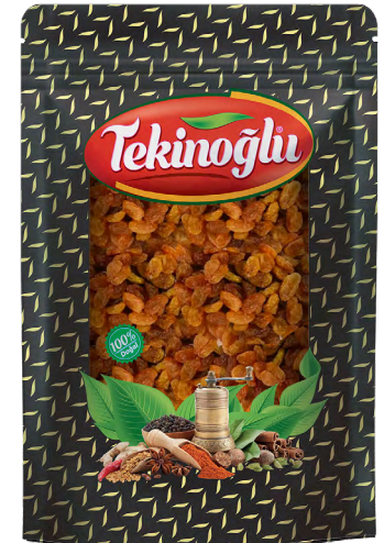
KURU ÜZÜM / RAISIN