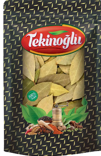
DEFNE YAPRAĞI / BAY LEAF