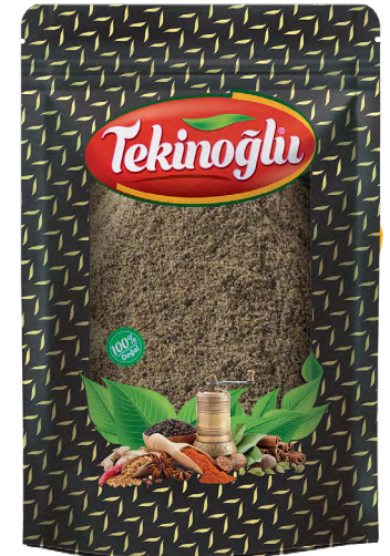
KARABİBER / BLACK PEPPER