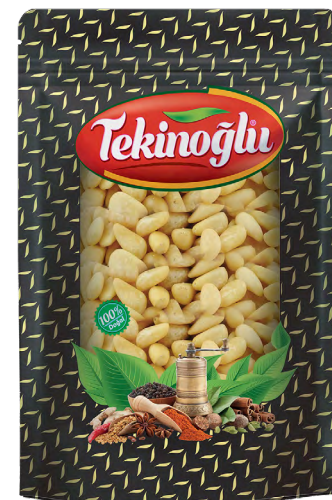
ÇAM FISTIĞI / PİNENUT