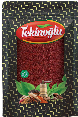
SUMAK / SUMACH