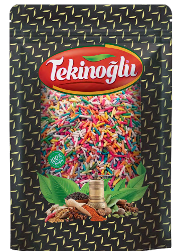
PASTA SÜSÜ / CAKE DECORATING