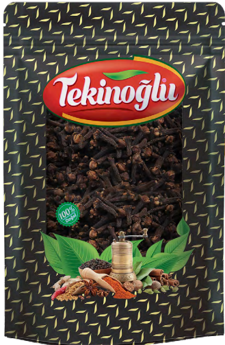
KARANFİL / CLOVES