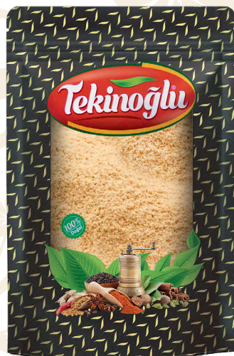
ZENCEFİL / GINGER