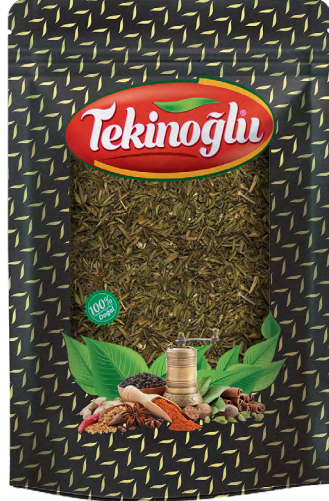
KEKİK / THYME