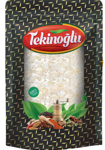
HİNDİSTAN CEVİZİ / COCONUT