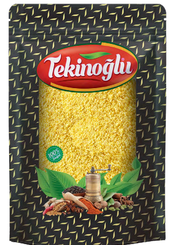
MISIR UNU / CORNFLOUR