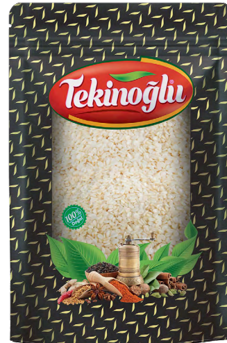
SUSAM / SESAME