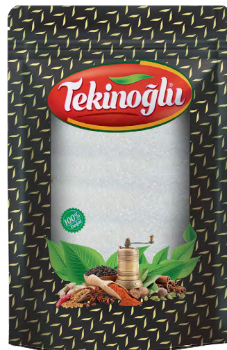
LİMON TUZU / CİDRİD ACID