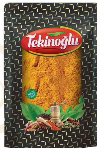
ZERDEÇAL / TURMERIC