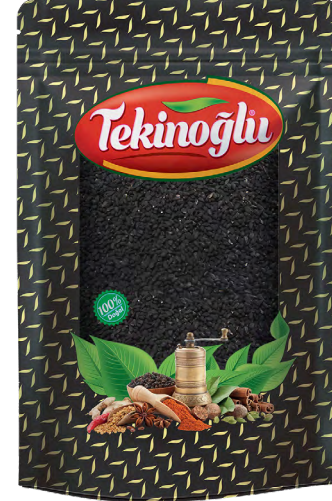
ÇÖREK OTU / BLACK CUMIN