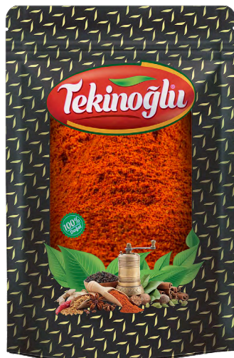
KÖFTE BAHARATI / MEATBALL SPICES