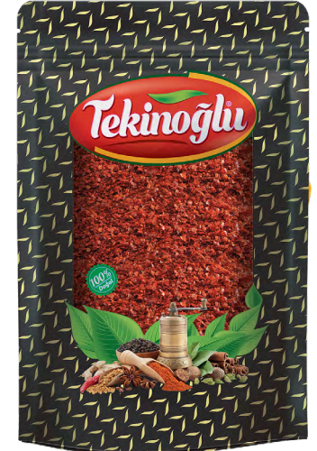
KIRMIZI PUL BİBER / RED HOT PEPPER