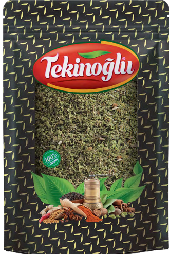
NANE / MINT